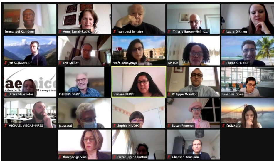
Capture d'écran de la session « Meet the editors »